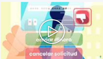
Vídeo 4 - Recepción de dinero