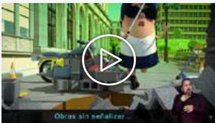
Vídeo 1 - Accesibilidad y movilidad en la vía pública: ¿Una carrera de obstáculos?

Bajo estas premisas, se elaboró una colección de videos en formato animado que muestran esta problemática adaptada a un lenguaje más amable. Los protagonistas de estos videos son los conocidos personajes de la serie "On Fologüers" de la Fundación ONCE.