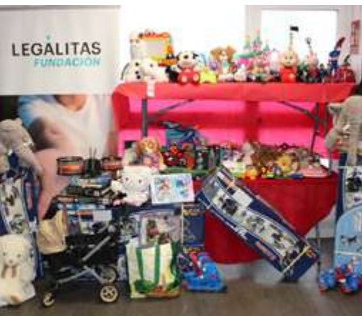
Recogida de juguetes

Y otro grupo de empleados participó en "Pajes Mágicos", acción consistente en la compra de regalos a los niños que nos hicieron llegar sus cartas a los Reyes Magos.