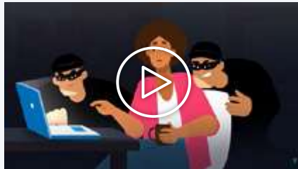
Vídeo 2 - Alquiler de vivienda