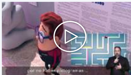
Vídeo 2 - Ocio y cultura inclusivos.