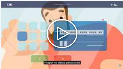
Vídeo 1 - Phishing

La campaña consta de cinco videos animados que representan situaciones recurrentes que pueden surgir cada vez que se opera en Internet. Asimismo, incluyen información de concienciación destinada a despertar el espíritu crítico de los ciudadanos a la hora de tomar decisiones sobre tales situaciones.