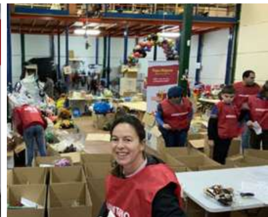
Voluntaria Legálitas recogida y clasificación juguetes.