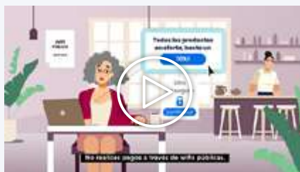
Vídeo 5 - Resumen prácticas seguras

Esta iniciativa se difundió en redes sociales obteniendo un resultado de más de 700 mil visualizaciones, más de 1 millón de impresiones y 6 mil interacciones. Para la Fundación Legálitas, esta acción da continuidad a su labor de promover el concepto de abogacía preventiva a través de campañas de sensibilización dirigidas a distintos colectivos.